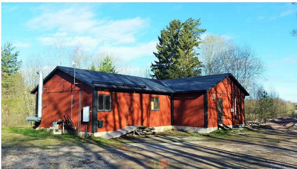
Figur 2. Flintavik avloppsreningsverk.

Reningsverket i Flintavik är uppkopplat mot ett övervakningssystem. Vid driftstörningar larmas personal från Mälarenergi via sms. Rondering på avloppsreningsverket sker minst 3 ggr/vecka.